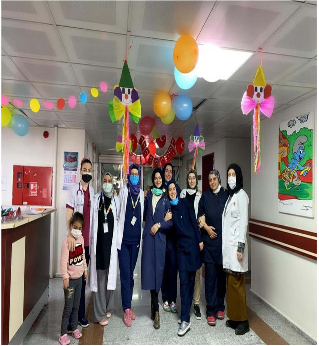
Klinik personelleri ile süslemelerin yapılması