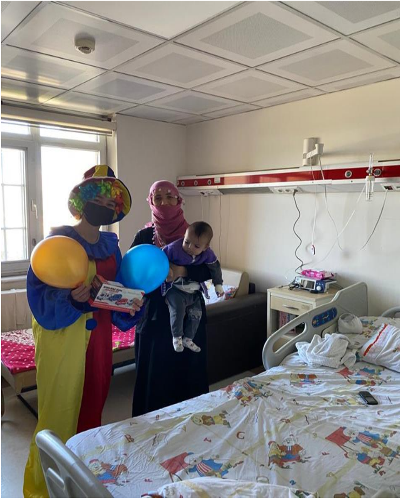
Palyaço ve çocuklar