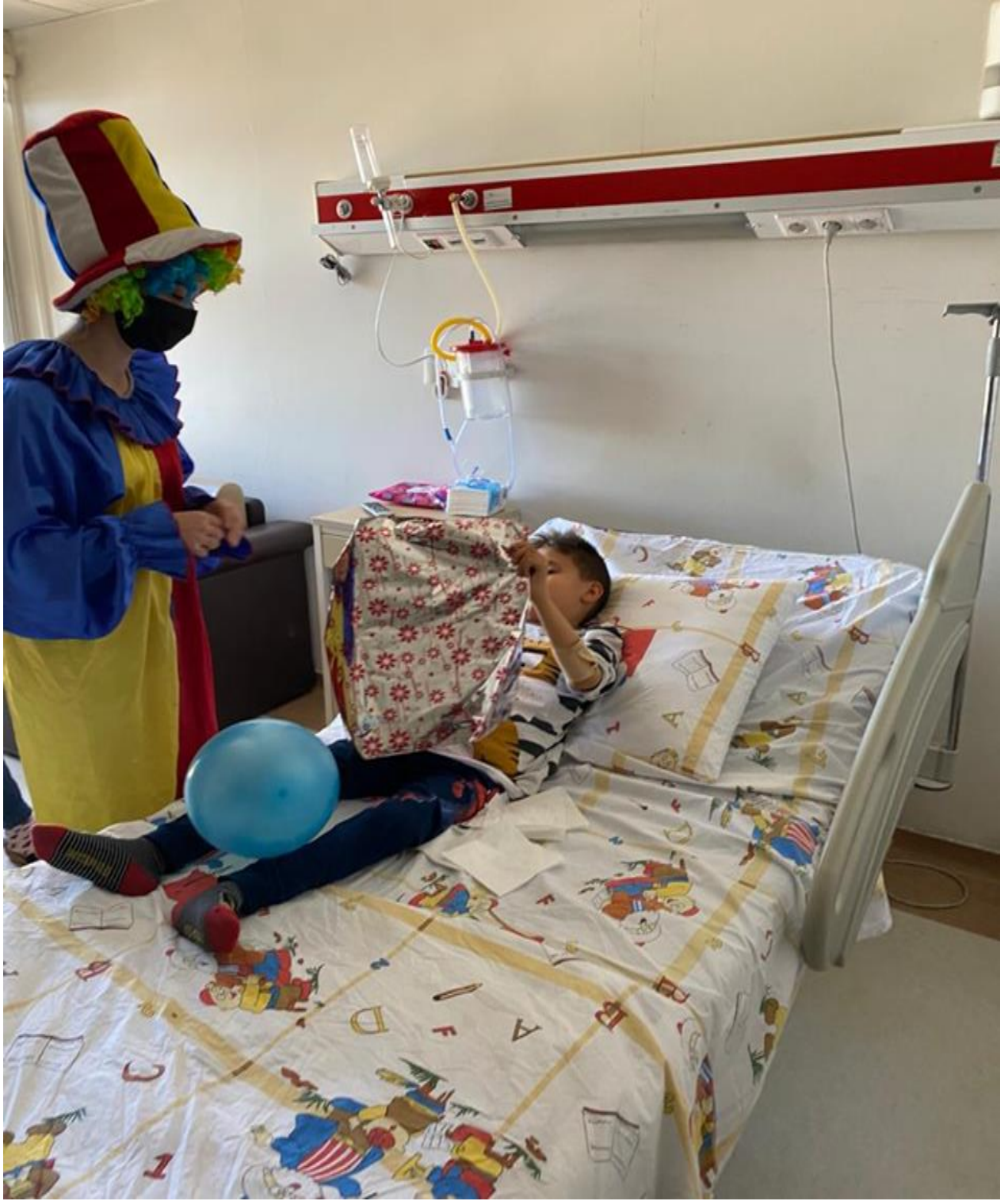
Çocuklara hediye dağıtılması