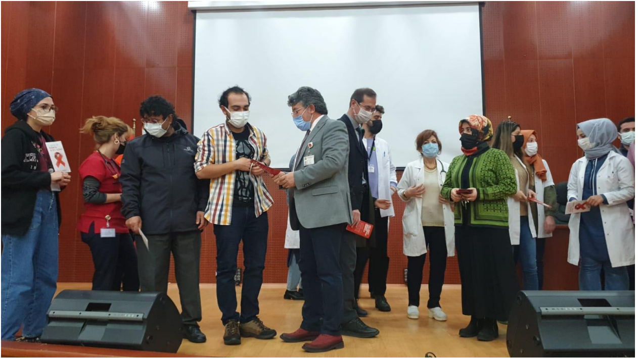
Proje kapsamında öğrencilerimize broşürler takdim edildi.