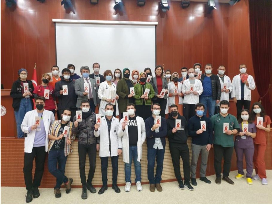
Proje kapsamında öğretim üyelerimiz, hastane idarecilerimiz ve öğrencilerimizle birlikte