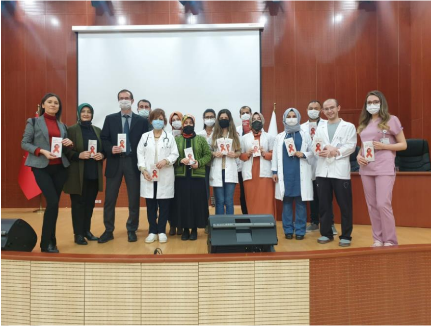
Proje kapsamında Enfeksiyon Hastalıkları ve Klinik Mikrobiyoloji Anabilim dalı olarak HIV/AIDS hastalarında “kaçırılmış fırsat”a izin vermiyoruz.