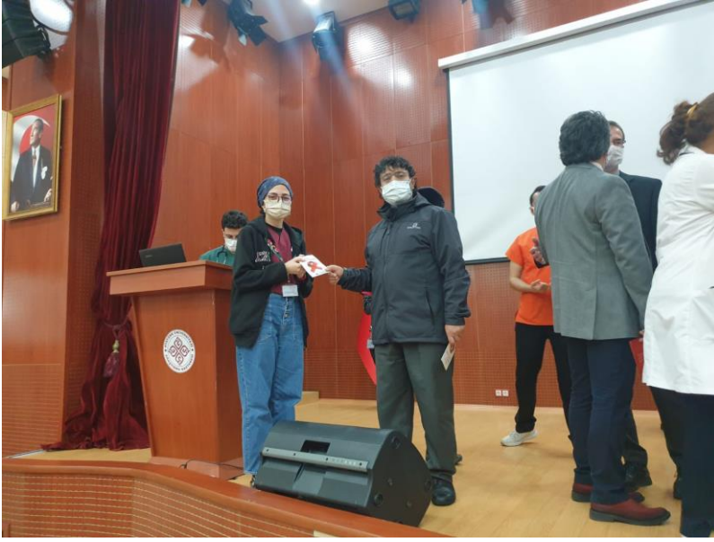
Proje kapsamında öğrencilerimize broşürler takdim edildi.