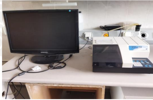
Şekil 3. ELISA tanı sistemi