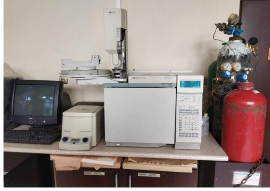
Şekil 2. MIS tanı sistemi