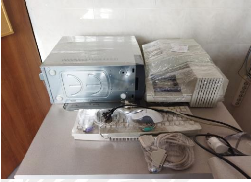
Şekil 1. BIOLOG tanı sistemi

Sonuç olarak; Ziraat Fakültesi Bitki Koruma Bölümü altyapısının güçlendirilmesi kapsamında sunulmuş olan FAD-2020-8571 nolu proje BAP birimi tarafından desteklenmiş olup BIOLOG sistemi bakım ve onarımı, MIS tanı sistemi bakım ve onarımı bitki büyütme kabinleri bakım ve onarımı ve ELISA sistemi bakım ve onarımı kalemlerinin tamamı projede belirtilen şartlarda ve süre içerisinde tamamlanmıştır. Bakım ve onarımı yapılan cihazlar ve kabinler ile ilgili şekiller aşağıda verilmiştir (Şekil 1, Şekil 2, Şekil 3 ve Şekil 4).