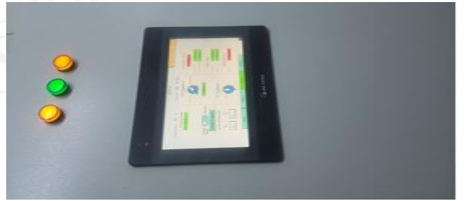
Şekil 4. Bitki büyütme kabinleri